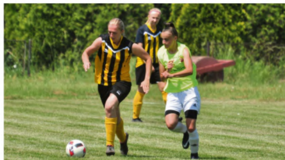
Piłkarki KKPNI Iskry Brzezinka zakończyły pierwszą rundę na siódmym miejscu w drugoligowej tabeli.