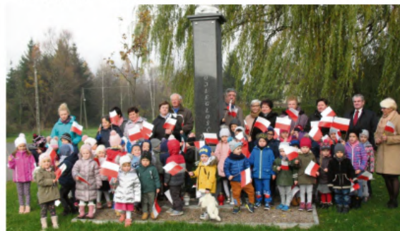
W Włosienicy najmłodsi uczcili Święto Niepodległości przy Obelisku razem z przedstawicielami miejscowych organizacji i władz sołeckich.