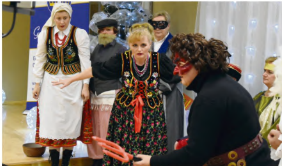
Przedstawienie "Szopka Krakowska".

wanie wystąpiła solistka, która prawdopodobnie skończyła już zerówkę i uczy się w szkole. Z pewnością jednak nie brakuje jej obycia z estradą.