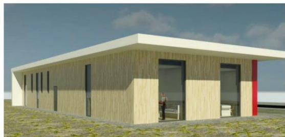
Wizualizacja projektowanej, nowej przychodni w Grojcu. Otwarcie nowej placówki planowane jest już na 1 września 2017 r.

rentgenowska, poczekalnia, gabinet stomatologiczny, dwa gabinety internistyczne, gabinet wielofunkcyjny mogący służyć różnym specjalistom, gabinet zabiegowy oraz część pediatriczną z osobnym punktem szpitalnym.