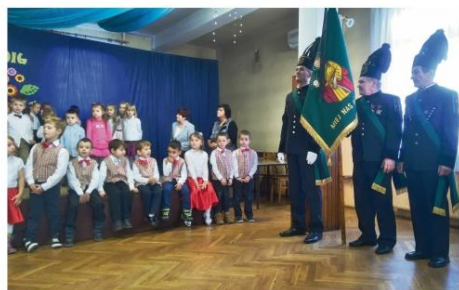
Barbórka we Włosienicy.