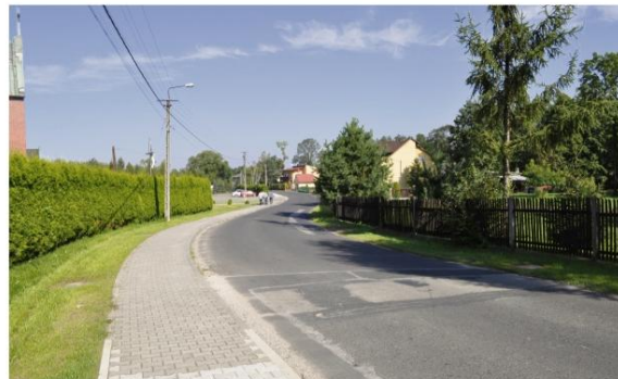
Chodnik wzdłuż ulicy Franciszkańskiej – bezpieczniej tak dla mieszkańców Harmęż, jak i gości Centrum św. Maksymiliana.