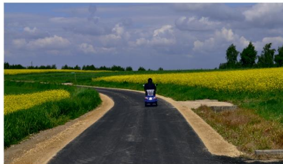
Inwestycja w ulicę Przecznicą ułatwia dojazd z Grojca do Osieka.