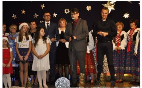
Kultura, Sportu i Rekreacji.