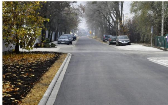
Jednym z ważniejszych kryteriów przy podejmowaniu decyzji o modernizacji dróg jest ilość remontów cząstkowych. Nowa nawierzchnia na takich ulicach pozwala w dłuższym czasie zaoszczędzić na doraźnym lataniu dziur. M.in. ten aspekt zadecydował o modernizacji ulicy Pławskiej w Brzezince.