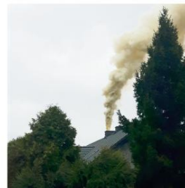
W naszej gminie jest w użyciu wiele tzw. „kopciuchów”.

Nierzadko są one opalane węglem złej jakości, dającym mało ciepła albo zawierającym kamień. Zdarza się, że do kotła trafiają nawet śmieci, co jest nie tylko naganne, ale też karalne. Znaczna ilość budynków w naszej gminie ciągle wyposażona jest w niskosprawne, przestarzałe piece węglowe, tzw. „kopciuchy”. Nie zapo-