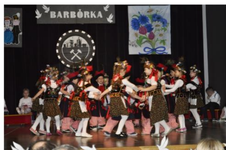
Barbórka w Grojcu.

Tegoroczne obchody Górniczego Świąta Przebiegały według sprawdzonych scenariuszy. Jednak tragiczny wypadek w kopalni miedzi "Rudna", do którego doszło w ostatnich dniach listopada, pozbawił je zwyczajowej radości i zabawy.